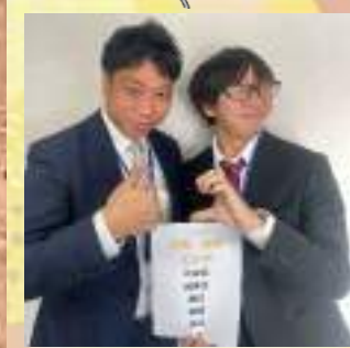
担当エリア：中央区・博多区・南区・精屋・筑豊 など

複数名でお客様をお守りできるように、エリア担当制にしました。各エリア2名+フロントでお客様をお守りいたします。エリアを絞っておりますので、いざという時、スピーディーに対応いたします。