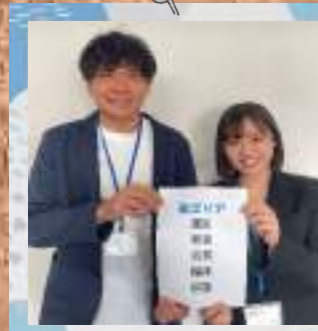
担当エリア：東区・新宮・古賀・福津・宗像 など

「見た目が若いね！」とお褒め？いただく41歳の中年男子と、4月に入社した新人です。